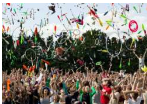
4-Le Toss'Up ! Convention de Bruneck 2015

Les conventions de jonglerie sont des lieux d'échange et de rassemblement pour les jongleurs. On y vient pour se retrouver, suivre ou donner des ateliers, voir des spectacles, en prendre plein les yeux, découvrir les nouveaux talents, les nouvelles idées. Apparues au milieu des années 1950, les plus grandes conventions rassemblent jusqu'à 6000 personnes, témoins de l'ampleur du développement de la jonglerie professionnelle et de loisir dans le monde.