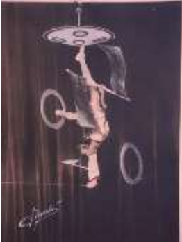
7-Les Reverhos sont à ce jour inégalés

Certains exploits en jonglerie sont tellement incroyables, qu’il vaut mieux les voir pour les croire. Et les décrire, cela prendrait trop de temps. Que cela soit les jongleurs de force, les jongleurs acrobates, les groupes de jongleurs, les images sélectionnées dans cette partie sont exceptionnelles et les figures souvent inégalées !