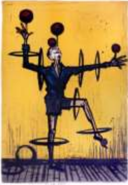
9-Jongleur, Edouard Buffet, 1968

Que cela soit en littérature, ou dans les arts graphiques, les jongleurs ont fasciné les artistes au début du XXème siècle. Plus encore, la figure du jongleur est reproduite quotidiennement de part le monde par les illustrateurs pour symboliser la gestion simultanée de plusieurs tâches. Certains en font même des dessins humoristiques !