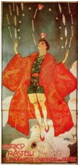
8-Rastelli, le plus grand jongleur

Si le concept de Star de la jonglerie peut nous sembler bien étranger, il fut un temps où les meilleurs des jongleurs atteignaient une célébrité mondiale, on parlait d’eux dans les journaux, les princes et les rois en faisaient leurs amis. Trois noms sortent du lot, Cinquevalli, Brunn, et Rastelli. Ce sont les Dali, Hendrix, Hugo de la jonglerie, ceux qui ont inspiré les autres à se dépasser et les inspirent encore !