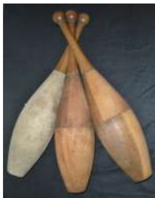
2- Massues Van Wyck, fin du XXème siècle. Premières massues produites en masse.

Les balles ont beau être l’objet de jonglerie le plus connu, encore fallait-il l’inventer ! Si maintenant les objets massues, balles, anneaux, diabolos, bâton du diable sont répandus, leur histoire est un véritable témoin de recherches des jongleurs pour mieux jongler, pour jongler avec autre chose, jusqu’à la production de masse des objets standardisés. Mais n’allez pas croire que tout a été inventé ! De nouvelles balles et massues, diabolos etc... sortent chaque année pour le plus grand plaisir des jongleurs.